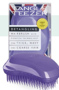
アイリスパープル