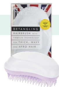
ホワイトライラック